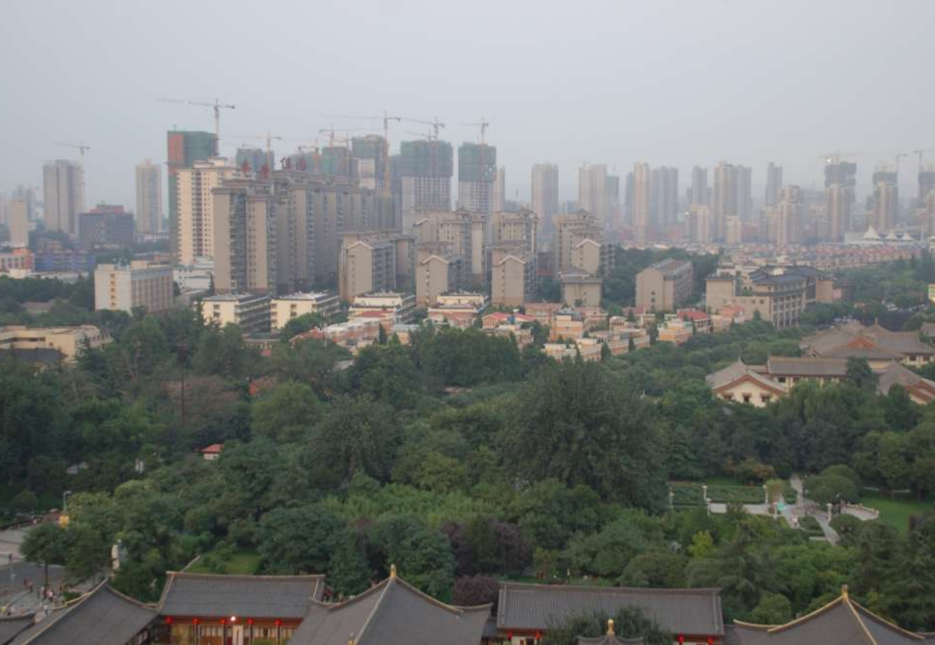
China – stadsuitbreiding Xi'an