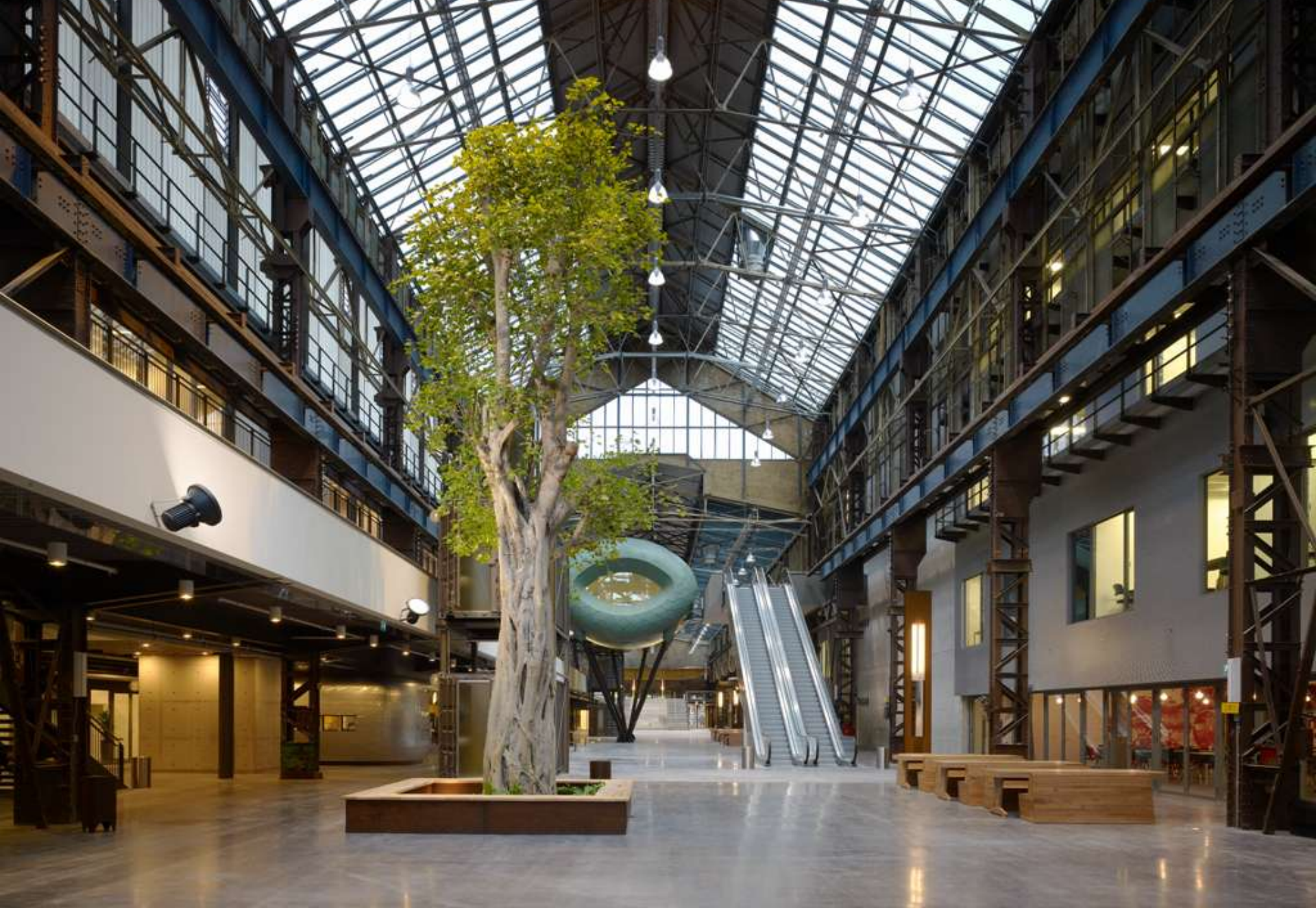
Hart van Zuid – centrale hal ROC, 2007 Harry Abels (IAA Architecten)