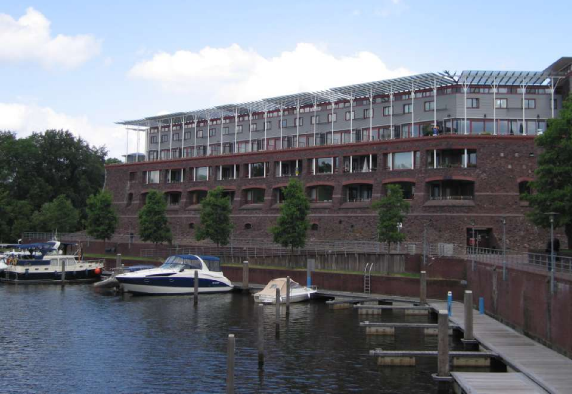
Zwolle - Maagjesbolwerk, 2003 Hans Ruijsenaars