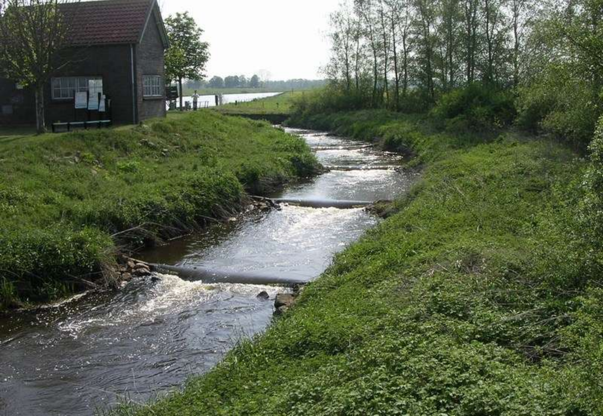
Vechterweerd - Vistrap