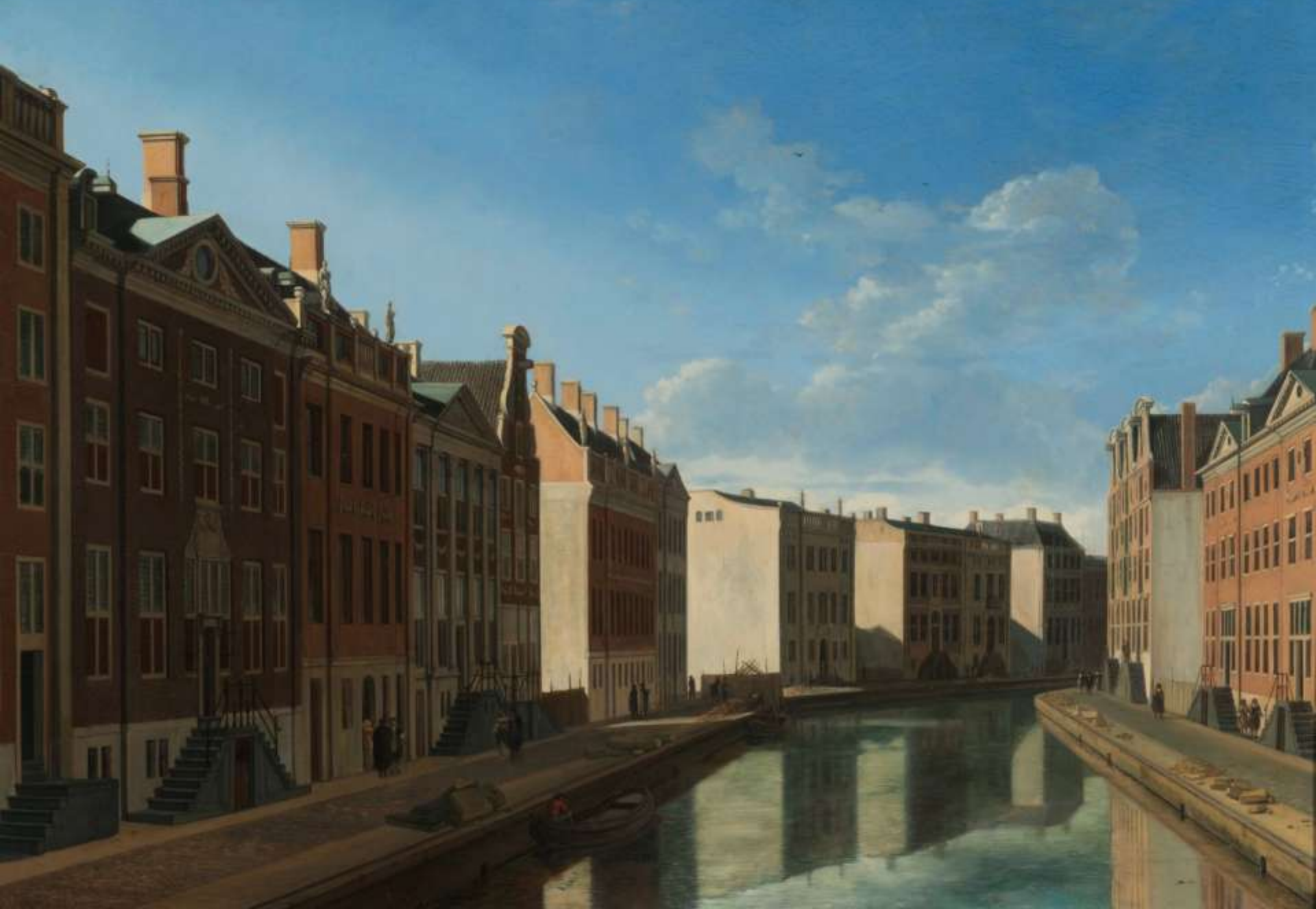
Amsterdam - Herengracht (1671 - 1672) van Gerrit Berckheyde