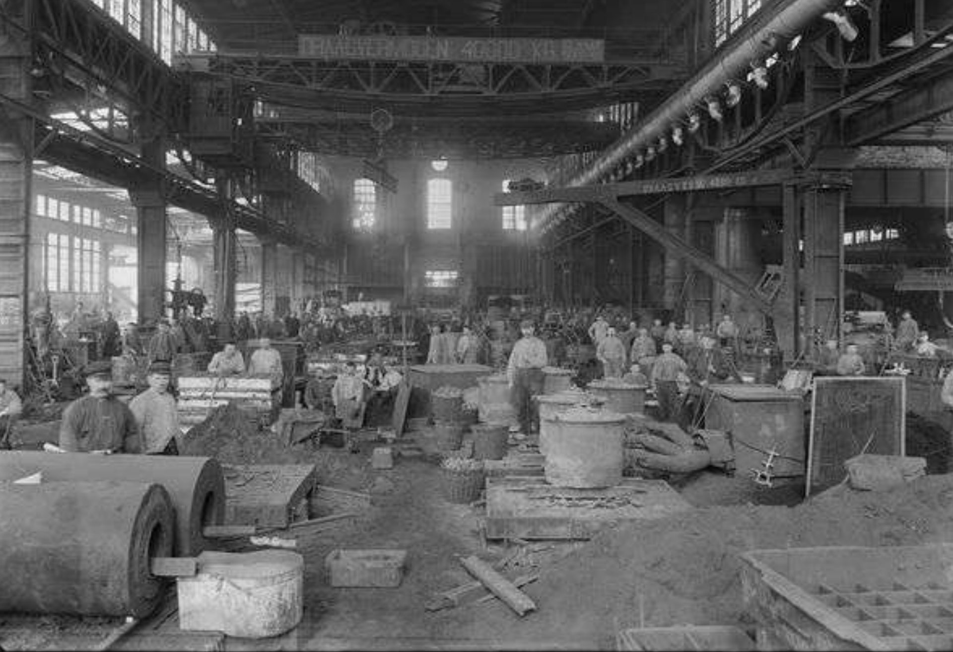
Hengelo - Gebr. Stork & Co, De Gieterij, 1901