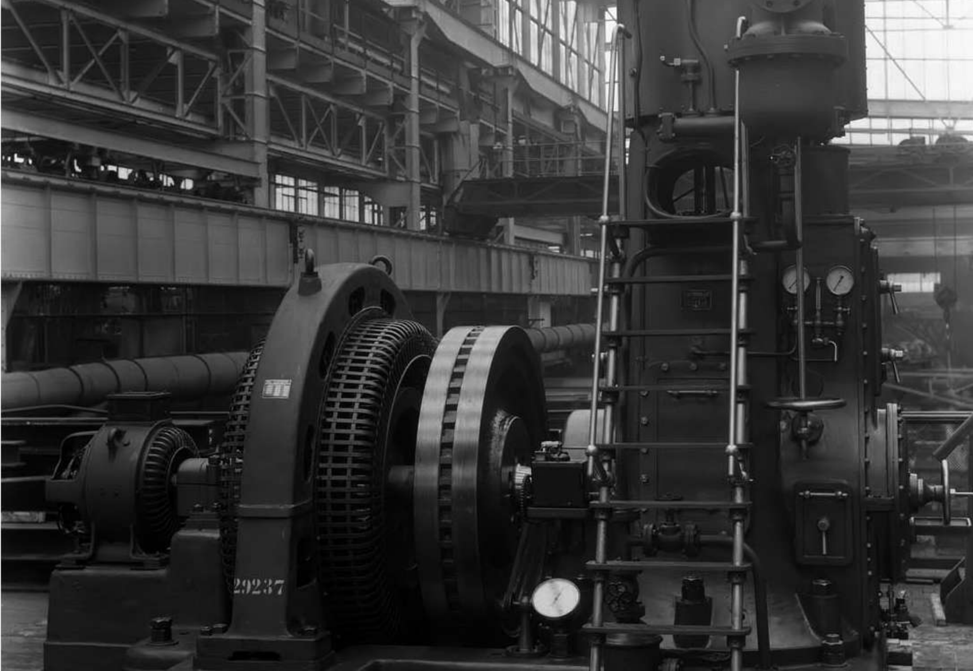
Hengelo - Gebr. Stork & Co, uitbreiding van De Gieterij, 1928